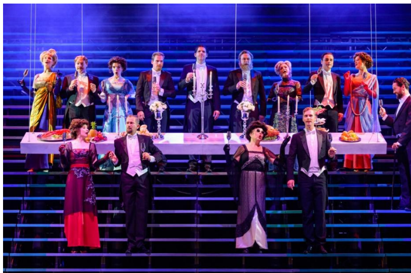
Titanic, de musical.

Voorafgaand aan de voorstelling was er een exclusieve meet & greet met de cast. Na de voorstelling was er mogelijkheid voor uitgebreid bijpraten en netwerken tijdens een gezellige borrel.